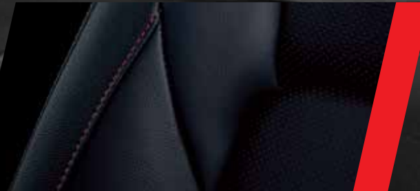
Butacas de cuero natural y ecológico con perforado rojo