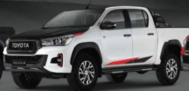
BLANCO PERLADO BI-TONO