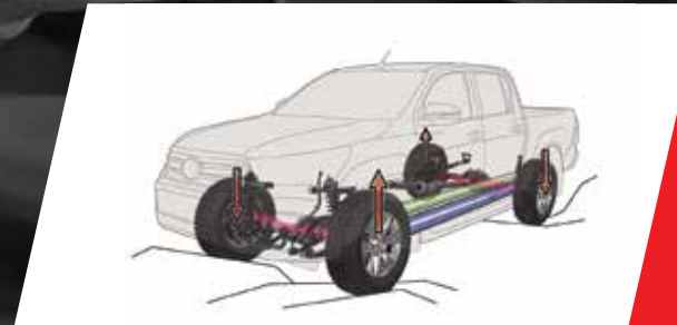
Control de tracción activo (A-TRC)