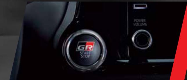
Sistema de encendido por botón con diseño Gazoo Racing