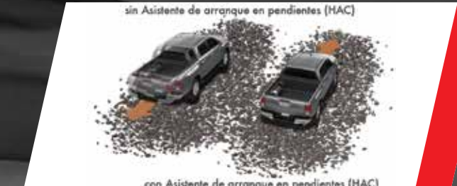
Asistente de arranque en pendientes (HAC)