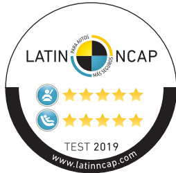
Hilux obtuvo 5 estrellas en protección para adultos y niños.