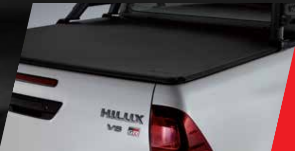
Cobertor de caja y lona