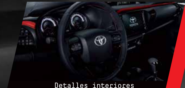
Detalles interiores y costuras color rojo