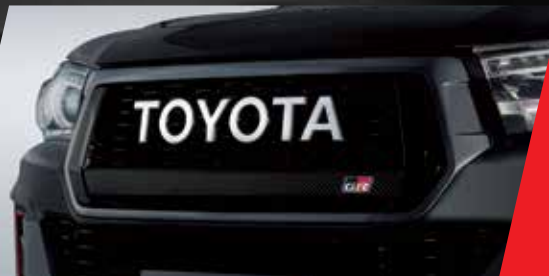
Parrilla exclusiva con emblema Toyota